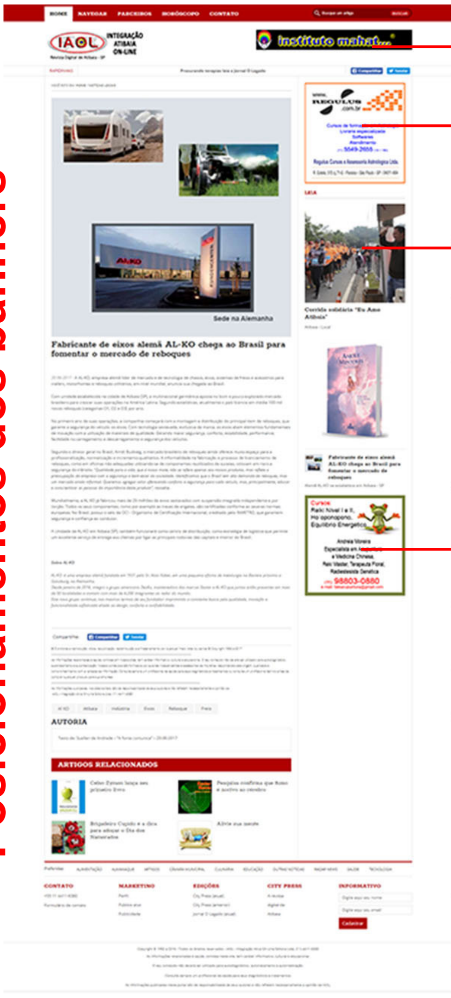
Banner Full * Formato: 468 x 60 pixels